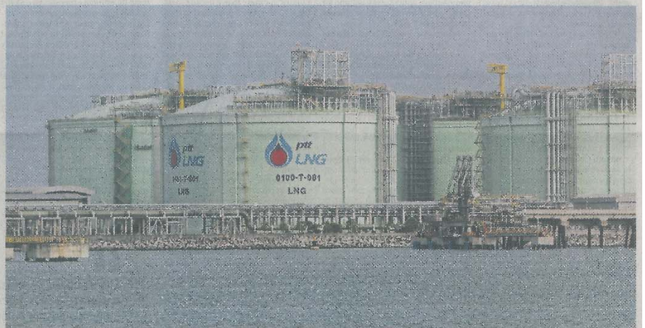
PTT's LNG receiving terminal in Map Ta Phut, Rayong. Egat's labour union is protesting the cancellation of an LNG purchase from Malaysia's Petronas.

Last Friday, Epac said the LNG spot price stood at US$4.5 per million British thermal units, while the gas price